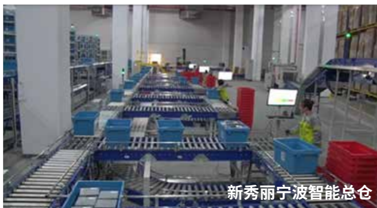
新秀丽宁波智能总仓

新秀丽引入FLUX OMS & FLUX WMS & FLUX TMS解决方案, 管理其从订单接收及分配, 到库内整合了门店B2B及电商B2C的订单拣选及库存共享, 再到门店配送为一体的新零售仓配物流业务, 并且双方将联手在新秀丽宁波仓打造一个全自动化的智能仓。